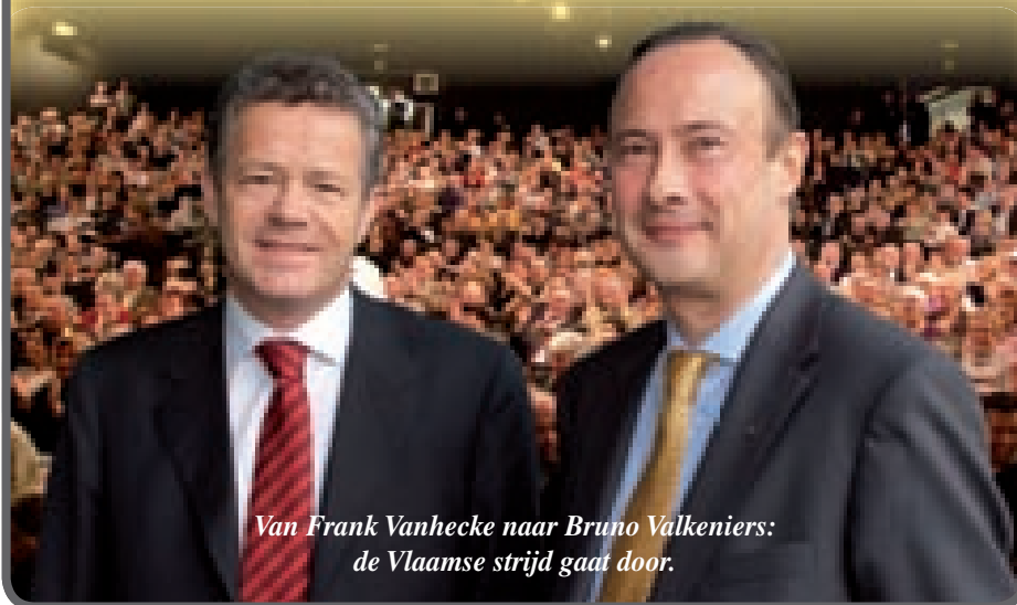
Van Frank Vanhecke naar Bruno Valkeniers: de Vlaamse strijd gaat door.

Bruno Valkeniers zal wellicht, met zijn eigen stijl, nieuwe accenten leggen. Maar met hem aan het roer zal de partij wel dezelfde koers blijven varen. Het Vlaams Belang gaat in elk geval de toekomst met vertrouwen tegemoet.